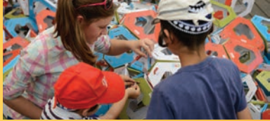
Titelbild: Mit Aufmerksamkeit schaffen diese „Baumeister von morgen“ im Bloomfield Science Museum in Jerusalem ein gemeinsames Werk.